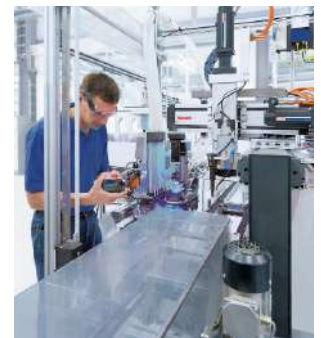
Gamme Bosch Rexroth®