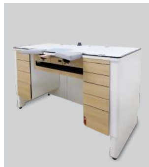
Mobilier de bureau