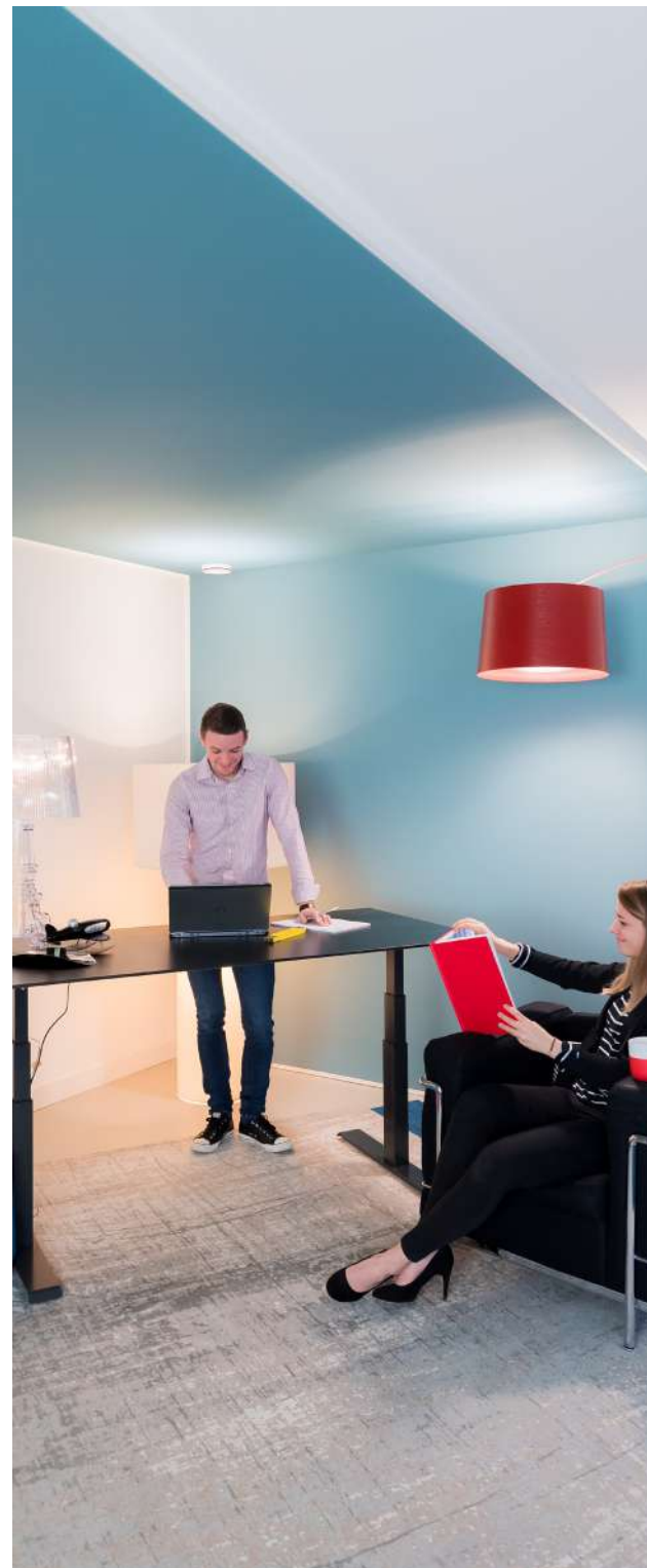
Bureau réglable électriquement Élément de commande avec écran et fonction de mémoire

DÉTAIL qui a son importance. Nous privilégions les circuits courts et l'économie locale; Nos tables sont développées, conçues et montées dans le Jura Suisse .