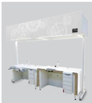
Hottes à flux laminaire