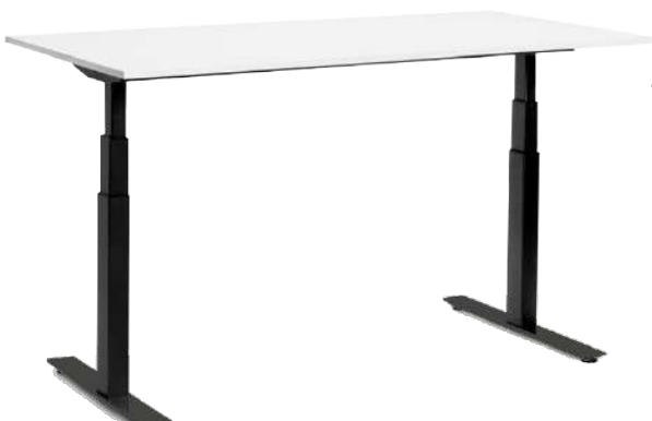
Bureau, Table de travail