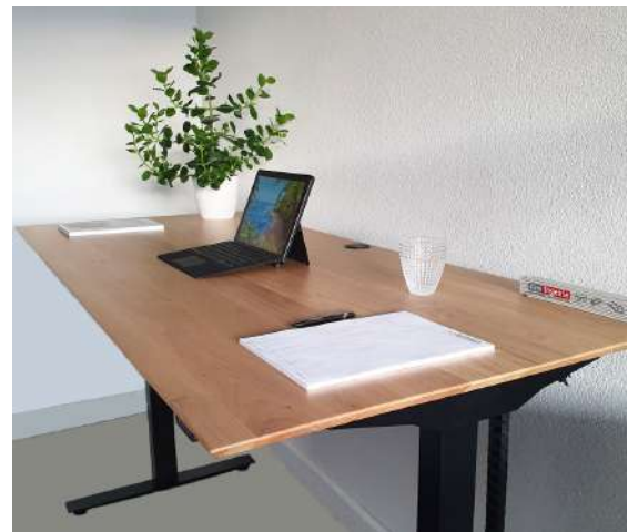
Plateau plaqué en chêne massif