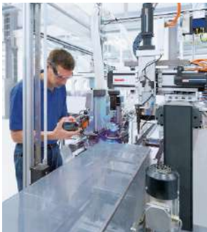
Gamme Bosch Rexroth®