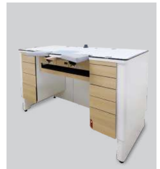
Établis & postes de travail