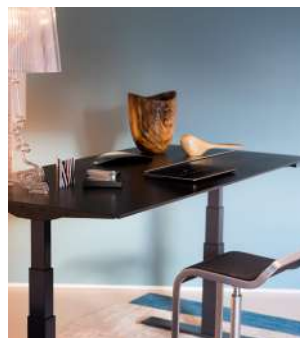
Mobilier de bureau