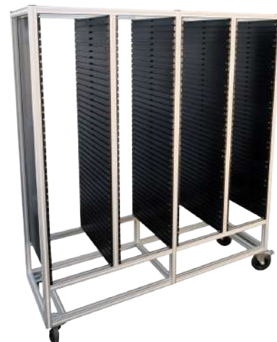
Chariot de rangements sur-mesure et personnalisables