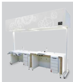
Hottes à flux laminaires