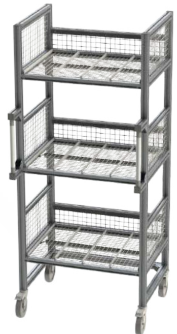
Station de nettoyage sur roues, chariot industriel ESD éléments modulaires, adaptables