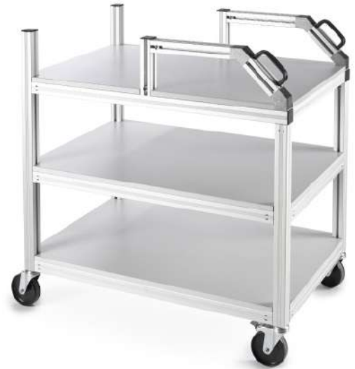
Chariots sur roues, chariots ESD sur mesure, de haute qualité