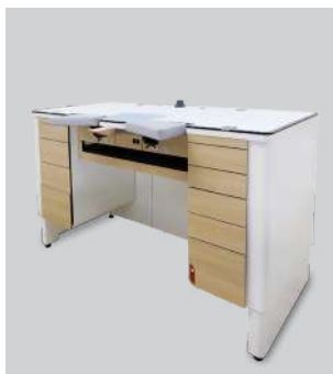
Établis & postes de travail