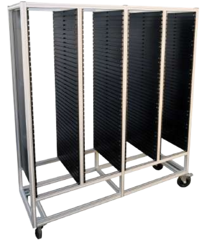
Chariot de rangements sur-mesure et personnalisables